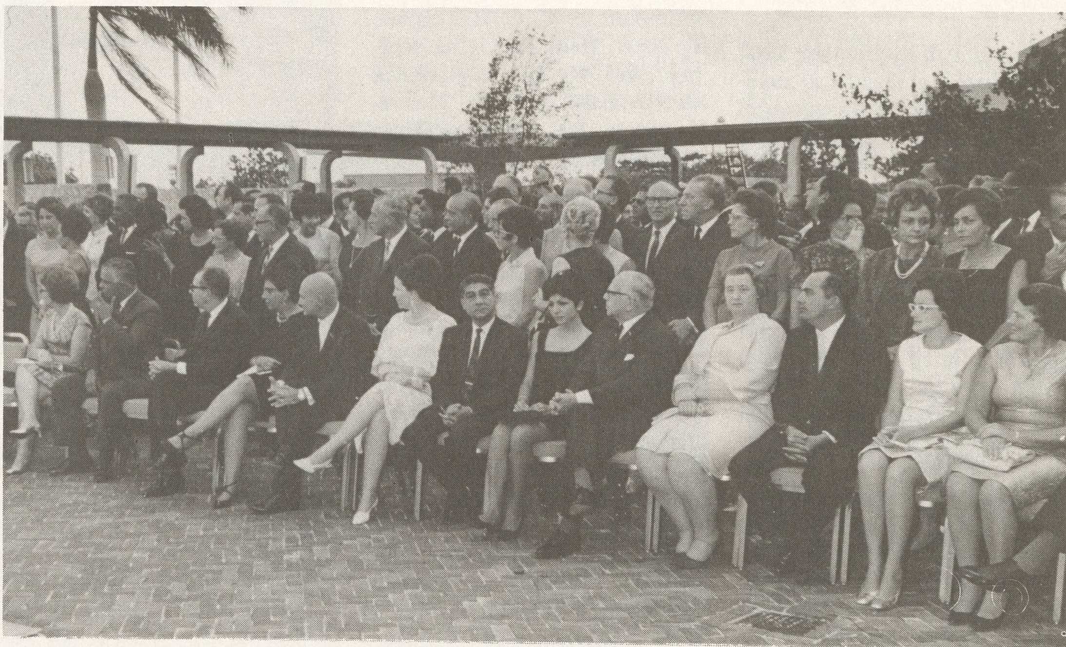
Den nos último número nos a publicá un foto di e último adquisicion riba terreno di medidanan pa ricibi i acomodá turistanan entre e diferente islanan, cu apertura di CURAÇAO HILTON HOTEL, lo cual mientras tantu a tuma lugar oficialmente di un manera mahestuoso. Esaki ta un bista di un parti chikí di e tantísima concurrencia cu a presencia e acto ei.

Di acuerdo cu un comunicacion di Su Exc. Minister di Sociale- en Economische Zaken, cu a sali publicá den corantnan local durante luna di December último, ta existí den hopi negoshinan e cus-